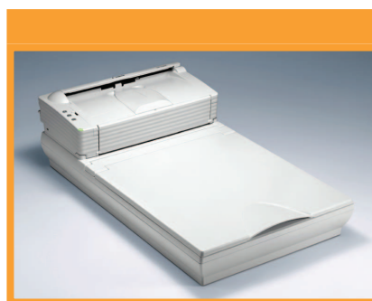
DR-2580C con Cama Plana Opcional

Compacto de gran alcance y veloz. El DR-2580C es un explorador versátil diseñado para resolver las necesidades diversas de exploración de imagen de su oficina. Esta máquina innovadora le ofrece las características más avanzadas de exploración de documentos. Mejor aún viene con la última versión de CapturePerfect y Adobe Acróbat. Lo más importante, es de Canon, la marca en que el mundo confía con sus altas tecnologías de solución de imagen.